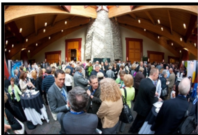
Dans le centre de conference Whistler, lieu de la CNLSS 2011